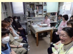
ミーティングの様子